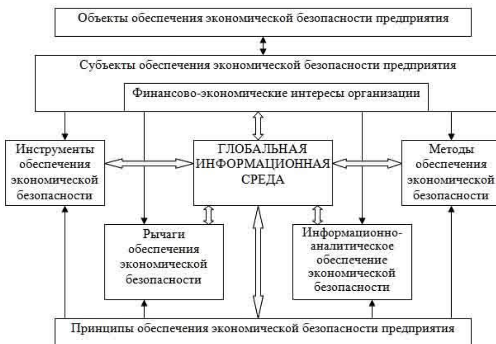
Рисунок 1.1 - Схема обеспечения экономической безопасности компании (организации, предприятия) [22, с. 123-129]

В анализе экономической безопасности страховой компании используются как динамические показатели, так и пороговые значения различных параметров. Осуществляя контроль финансовой и хозяйственной деятельности компании, руководство уже может увидеть возможные проблемы в действительности мер по осуществлению защиты интересов страховой компании.